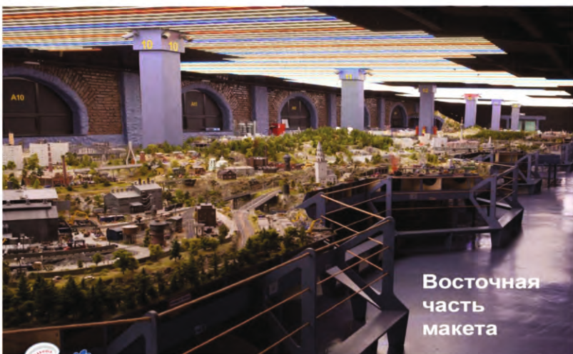
Восточная часть макета